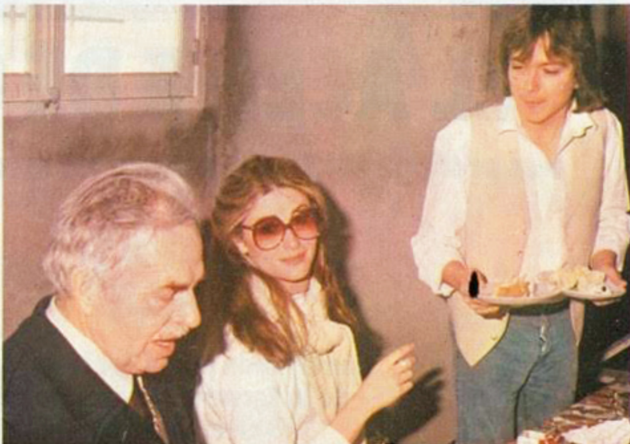
James Mason también forma parte del reparto de «The Passage»