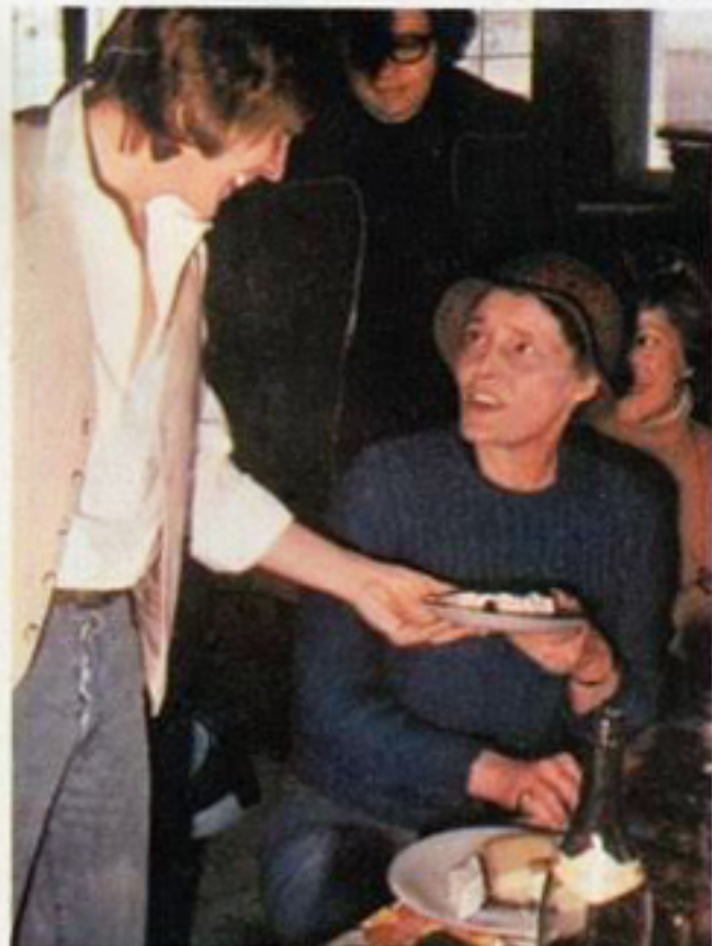
David Cassidy dándole la tarta a la veterana Patricia Neal

actriz experimentada que ha trabajado en series de éxito como «Hombre rico, hombre pobre», donde interpreta el breve papel de «esposa de Nick Nolte. Este detalle había pasado desapercibido para muchos.