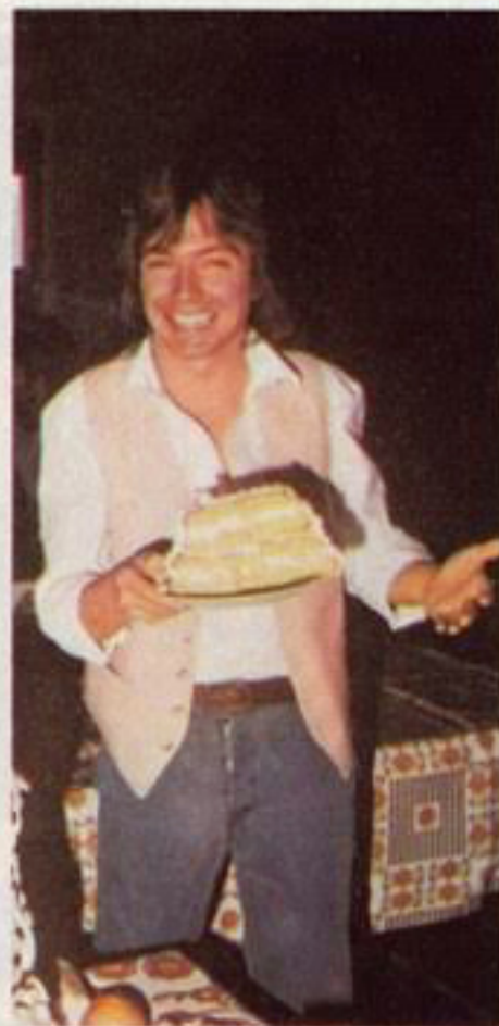
Hubo tarta enorme por los veintiocho años de David

DAVID Cassidy y Kay Lenz, que hace poco más de un año sorprendieron a todo el mundo con su boda-sorpresa, son la pareja romántica indiscutible en el rodaje de la película «The Passage», en la que también intervienen Patricia Neal, James Mason y Anthony Quinn. Se les ve juntos siempre y continuamente acaramelados y haciéndose arrumacos. Bueno, siempre no porque Kay se levanta