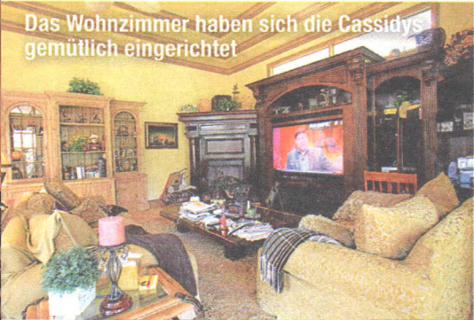
Das Wohnzimmer haben sich die Cassidys gemütlich eingerichtet