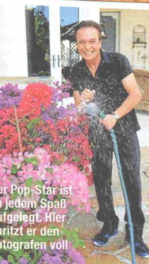
Der Pop-Star ist jedem Spaß angelegt. Hier pritzt er den Fotografen voll