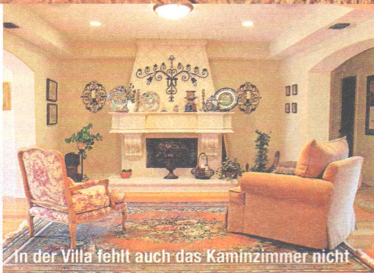
In der Villa fehlt auch das Kaminzimmer nicht