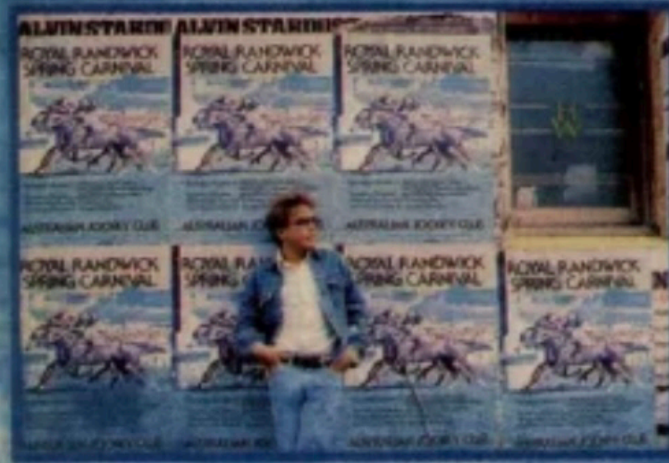
Gern hätte sich David, der Pferdenarr, das durch Plakate angekündigte Rennen um den Melbourne-Cup angesehen. Aber er mußte eine Woche vor dem Start wieder zurück nach Kalifornien