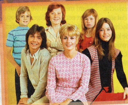
Met 'The Partridge Family' werd David een echt tieneridool.